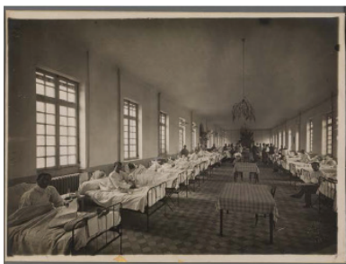
Lyon. Hôpital municipal Saint Jean Dieu. Salle Jeanne d'Arc. 1915