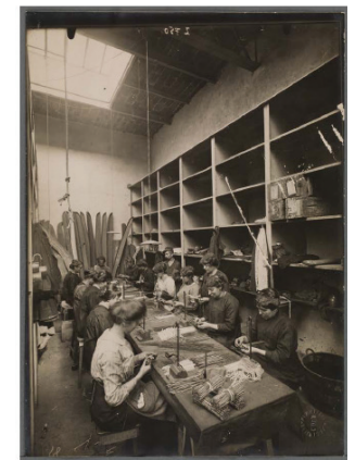
Lyon. Arsenal de la Mouche. Atelier de confection des planchettes pour obus à balles de 75